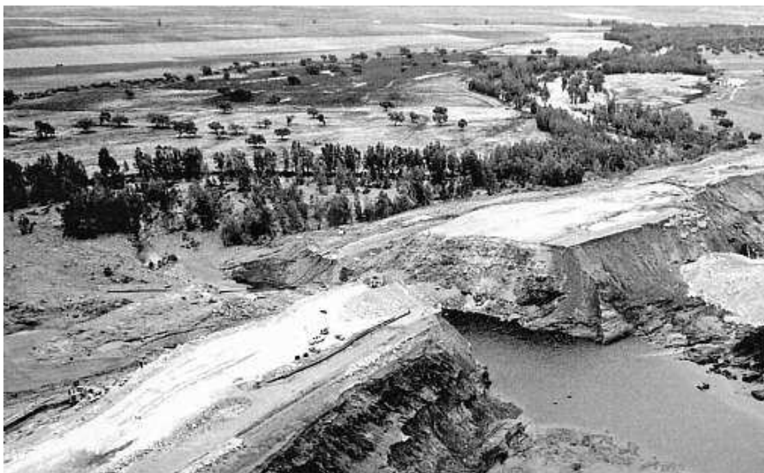
La rotura de la balsa minera de Boliden todavía sigue generando polémica